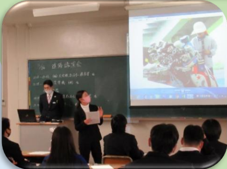
企業による説明会

「産業社会と人間」の授業ではさまざまな企業の方々に来校していただいて、自分の興味のある分野の話聞くことができます。