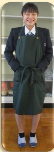
家庭科の授業の様子