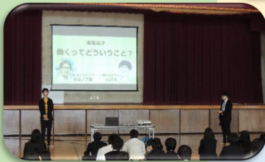
お笑い芸人による講演会