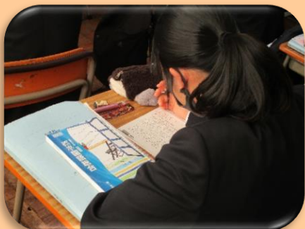
国語の授業の様子