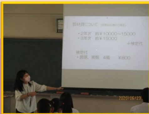
「産業社会と人間」の様子

入学後、1年の「産業社会と人間」の授業をとおして、2・3年でどの系列に進むかを考えていきます。