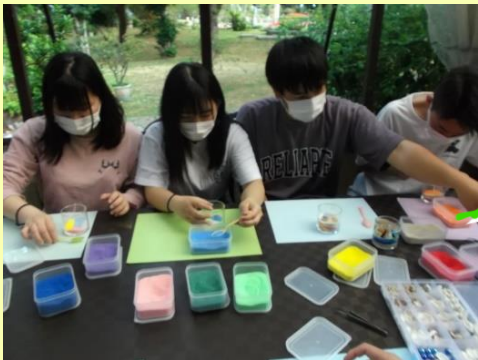
ジェルキャンドル作り

初めての ジェルキャンドル作り 楽しかったです！ 完成したキャンドルも 可愛くて いい思い出に なりました♡