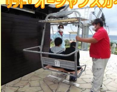
リフト「オーシャンスカイ」