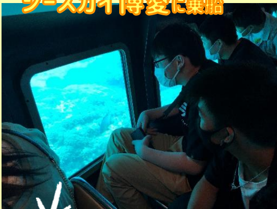
シースカイ博愛に乗船