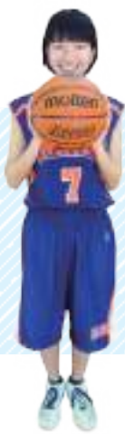
バスケットボール