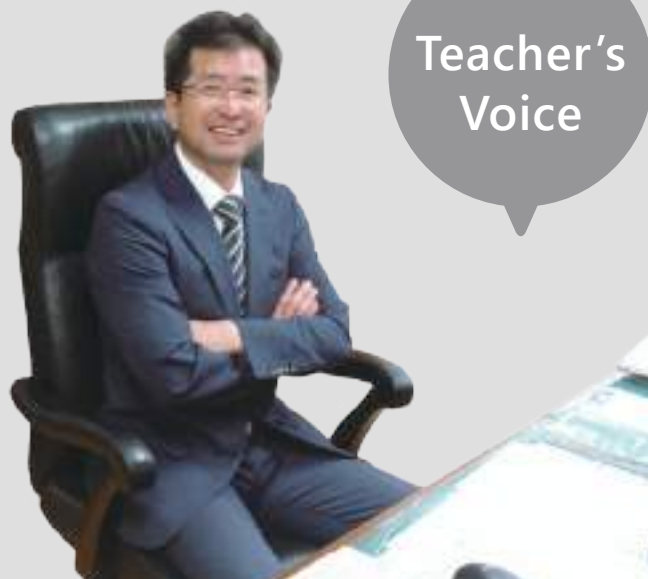
坂東地区新校準備委員会委員長 (岩井高等学校校長)