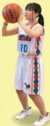
女子 バスケットボール