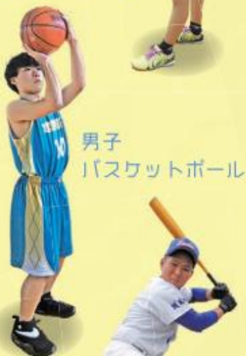
男子 バスケットボール