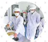
フードシステムコース

環境デザインコース 生活環境をデザインする造園技術、測量について学習します。 フードシステムコース 地域の農産物を使って加工品の製造について学習します。