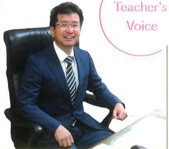
茨城県立坂東清風高等学校長